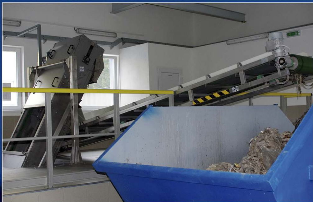
Hrebeňové hrablice bez zateplenia a vyhrievania inštalované v budove