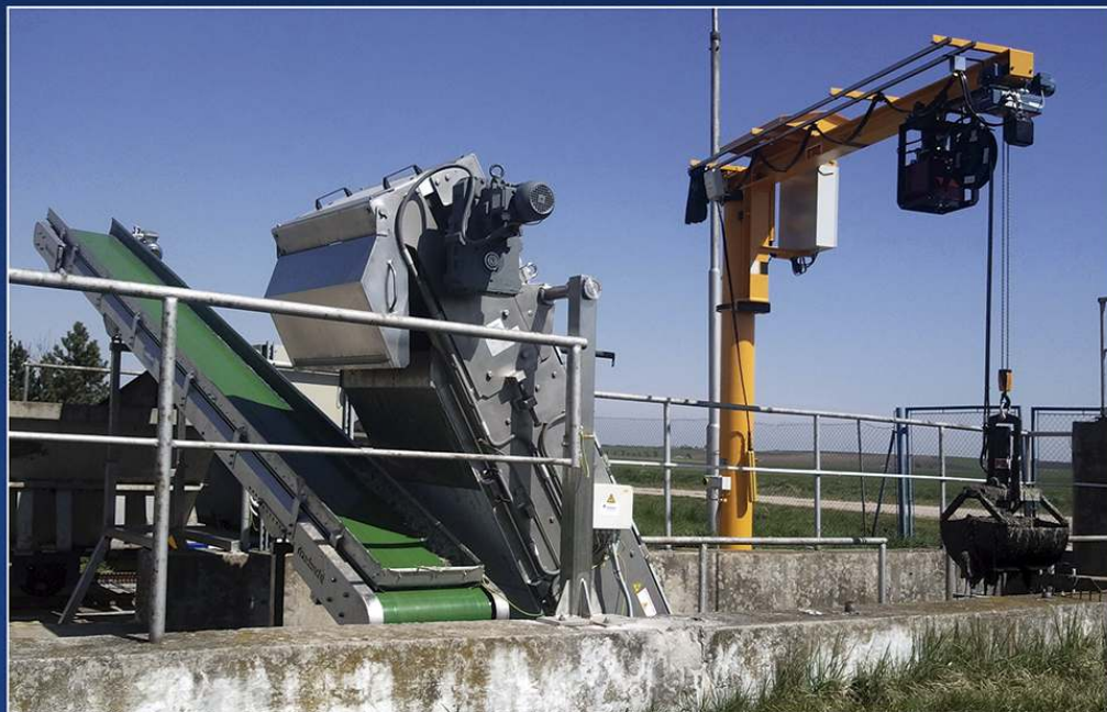
Hrebeňové hrablice so zateplením a vyhrievaním inštalované vo vonkajšom prostredí