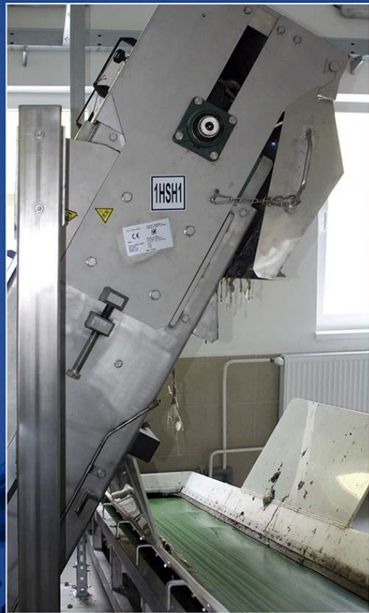
Inštalácia hrebeňových hrabíc s pásovým dopravníkom