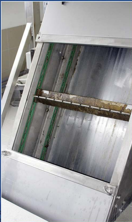
Detail vynášacieho hrebeňa hrabíc